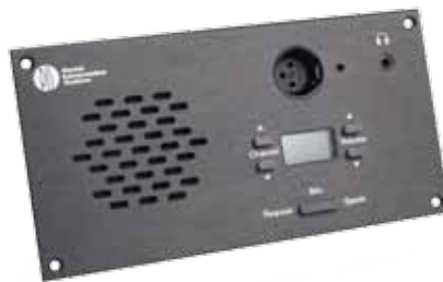
仕様 CM 6080 F / DM 6080 F