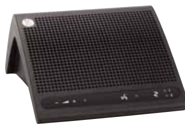
仕様 DC 5980 P