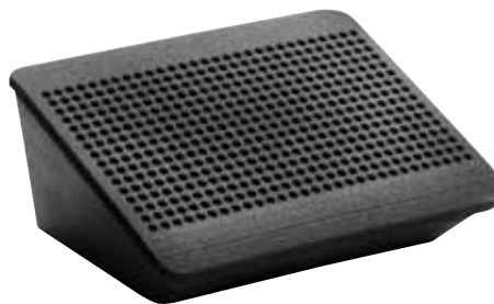
仕 様 LS 5900 F