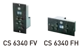
CS 6340 FV CS 6340 FH