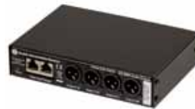
仕様 AO 6004