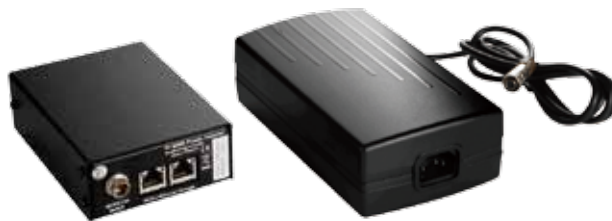
PI 6000 (電源供給ユニット)