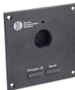
FC 6021 F