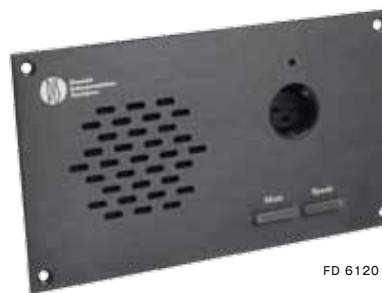
FD 6120 F