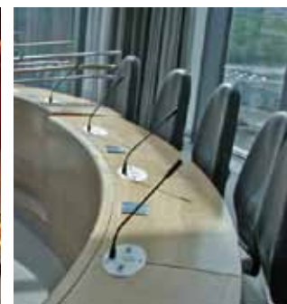
フロントを丸みのある形に