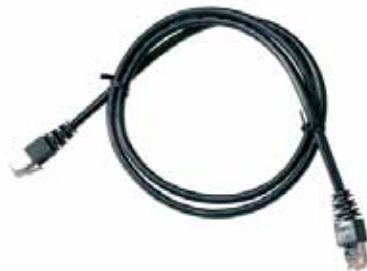
仕様 EC 6001