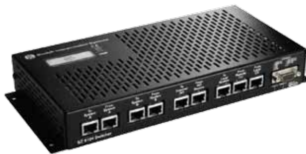
仕様 SZ 6104