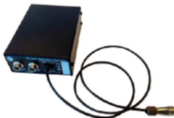
仕様 RC 6000