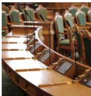
埋め込みユニットにモニターをはめ込み

会議ユニットなどすべての機器の形状、素材、仕上げ、カラーを部屋のデザインや用途に応じてカスタマイズできます。