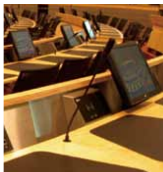
マイクロホンを机上に