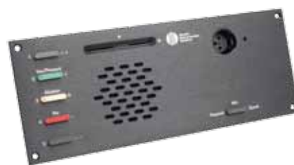
仕様 CM 6620 F / DM 6620 F