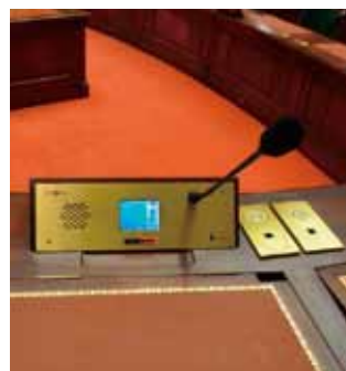
フロントをゴールド仕様に