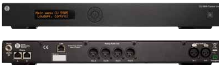
仕様 CU 5905