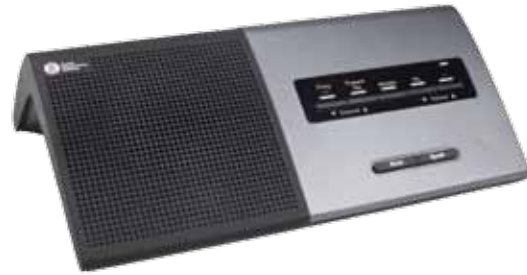
仕 様 DM 6680 P