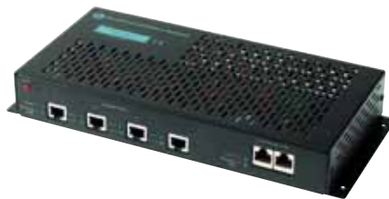
仕様 RP 6004