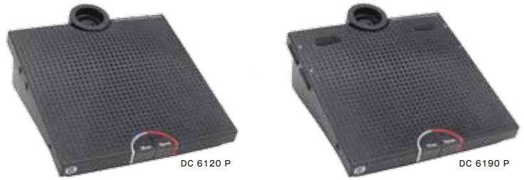
仕 様 DC 6120 P / DC 6190 P