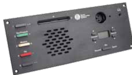
仕様 CM 6680 F / DM 6680 F