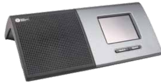
仕 様 DC 6990 P