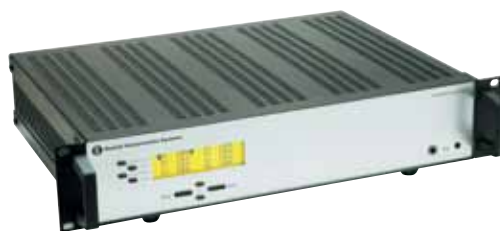
仕様 AO 6008