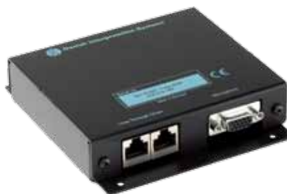
仕様 MU 6040 C / MU 6040 D