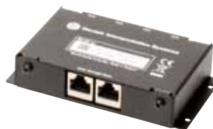
仕様 JB 6104