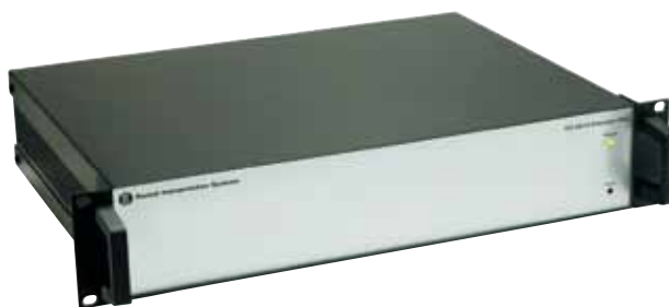
仕様 EX 6010