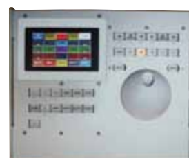
専用コントローラー ■EC-1 オープンブライス