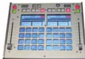
専用コントローラー ■KP-4 オープンブライス