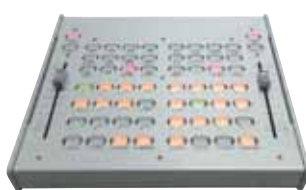
専用コントローラー ■KP-1 オープンブライス