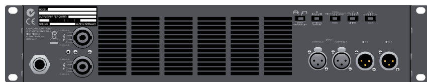
D-Power 7 背面パネル