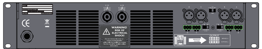
Q-Power 10、6 背面パネル