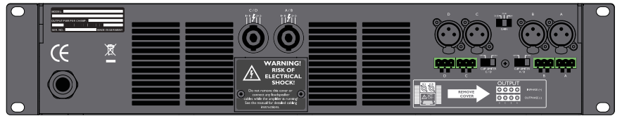
Q-Power 10、6 背面パネル