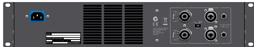
D-Power 1, 05 背面パネル