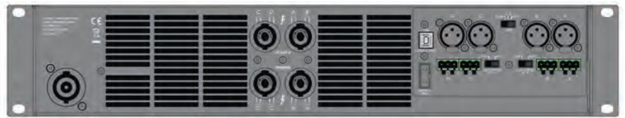
Q-Power 14 背面パネル