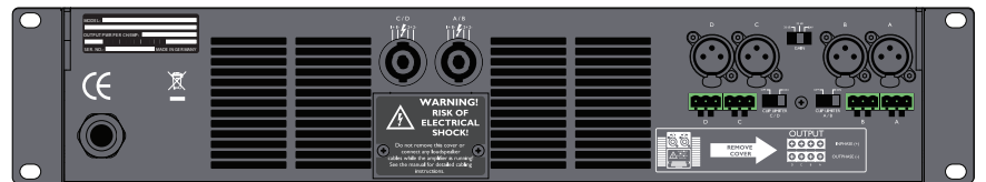
Q-Power 10 背面パネル