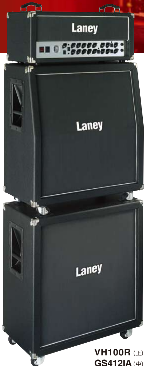
VH100R (上) GS412IA (中) GS412IS (下)