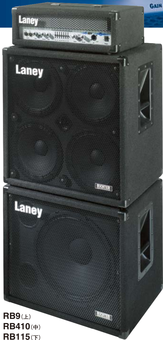
RB9(上) RB410(中) RB115(下)