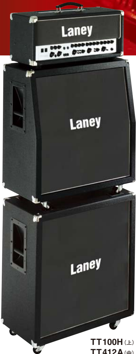
TT100H (上) TT412A (中) TT412S (下)