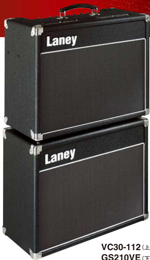
VC30-112 (上) GS210VE (下)