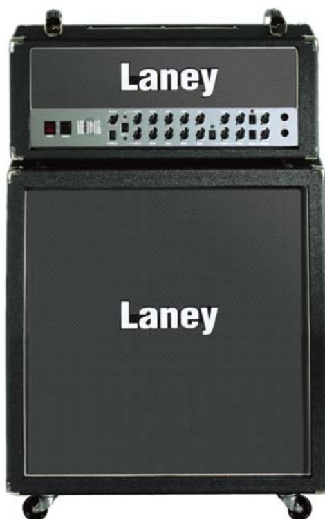
VH100R (上) GS412IA (下)

細部に至るまで満ちあふれたクオリティへのこだわり。 フラッグシップを名乗るに相応しい究極のポテンシャル。