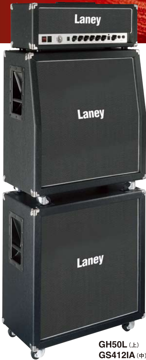
GH50L (上) GS412IA (中) GS412IS (下)