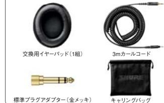
交換用イヤークリップ(1組)