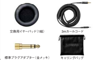
交換用イヤークップ(1組)