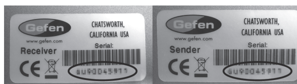
シリアルナンバー表示例