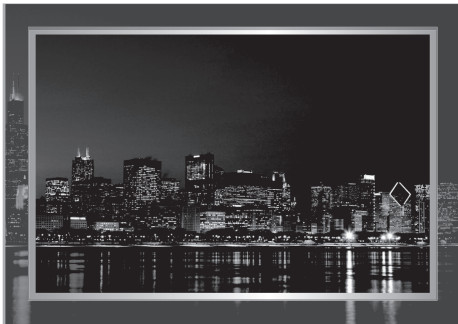
※ Over Scan で表示されたイメージ

表示している画像の周囲がはみだして映る場合（下図の灰色部分）は、Over Scan/Under Scan スイッチを Under Scan に設定してください。