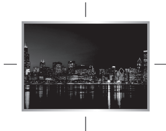
※ Underscan を適用した場合のイメージ