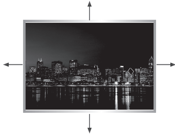
※ Overscan を適用した場合のイメージ