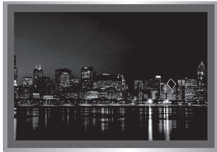
※ Underscan で表示されたイメージ

表示している画像の周囲に黒い帯が映る場合は、Over Scan/Under Scan スイッチを Over Scan に設定してください。