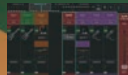
コンプリートチャンネル