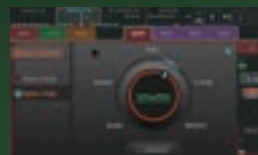
クイックチャンネル

CQには1つのつまみだけでプロセッシングの包括的な調整を行うクイックチャンネル、全てのパラメーターを調整可能なコンプリートチャンネルの2つのミキシングモードを用意。PAに不慣れな方であればクイックチャンネルで使用するチャンネルの用途（スピーチ、ボーカル、ギターなど）を指定し、つまみ1つを調整するだけで用途に最適な調整が完了します。もちろんサウンドにこだわるエンジニアはコンプリートチャンネルですべてのパラメーターを狙い通りに調整可能。あらゆるレンジの音楽シーンに柔軟に対応します。さらにCQには新たなアルゴリズムを搭載したFXタイプを内蔵。楽器などの用途固有のプリセットを搭載し、極めてシンプルな調整で熟練のオペレーターに匹敵する素晴らしいエフェクト効果を実現します。