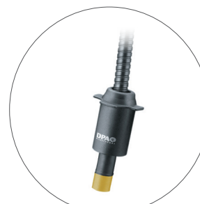
▲低感度マイクロホン 型番 : 4099-DC-2