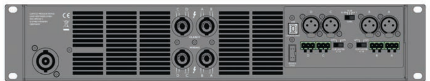
Q-Power 14 背面パネル