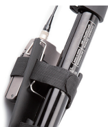
▲ XLR 変換アダプター (DAD6001-BC) 使用時 ▲ ボディバック型送信機使用時