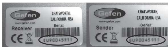
シリアルナンバーの表示例

本製品には、送信機と受信機に同一のシリアルナンバーが割り振られています。万が一、不具合が発生して修理の依頼などを行う場合は、本体裏面に記載されているシリアルナンバーをご確認いただき、同一のシリアルナンバーが割り振られた送信機と受信機の両方を発送してください。