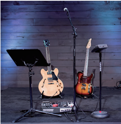
5本のスタンドを使用