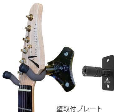
壁取付プレート IO-W(左)、IO-WSP(右)

楽器を使用していないときは、お気に入りの楽器をディスプレイとして安全に吊り下げられます。