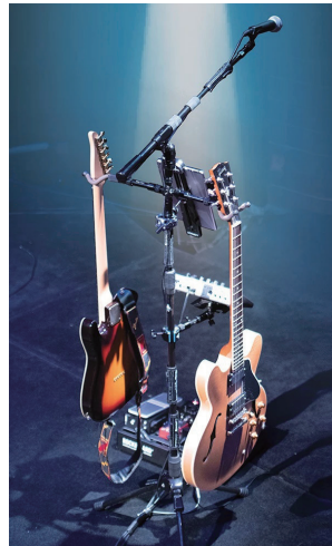
TRIAD-ORBITの既存製品群を使用して 必要な機材を1本のスタンドに集約

楽器ハンガーシリーズを壁に取り付けるには、TRIAD-ORBITの壁取付プレート「IO-W」や「IO-WSP」と一緒に使用します。