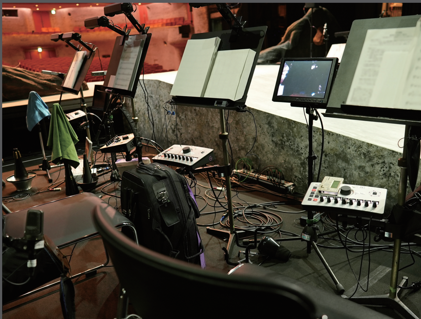
▲ オーケストラピット内、各プレイヤーにセットされた KLANG:technologies 「kontroller」 Strings、Brass、WoodWind、Perc.、Gtr. など合計 22 台が使用されている。

このたび劇場内のオーケストラピットで使用される指揮者とプレイヤー用のパーソナルモニターとして、KLANG:technologies の「vokal」と「kontroller」が納入されました。vokalは、イマーシブ・インイヤーモニタリングを高性能なレベルで実現するミキシングプロセッサです。各プレイヤーの手元にある kontroller は、明快な操作感で個々人の好みに合わせた設定が可能、かつ 96kHz の高音質なイマーシブ・サウンドを提供します。