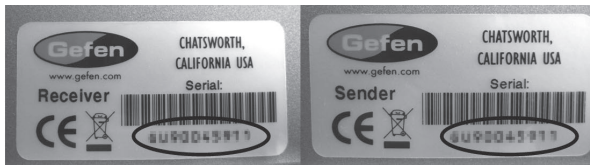
シリアルナンバー表示例

本製品には、送信機と受信機に同一のシリアルナンバーが割り振られております。万が一、不具合が発生し修理の依頼などを行う際には、本体裏面に記載されているシリアルナンバーをご確認いただき、シリアルナンバーを揃えた状態で、 送信機と受信機の両方 をご発送いただけますようお願いいたします。